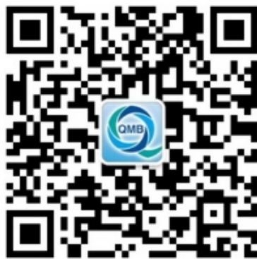
附图：质量标杆微信平台二维码