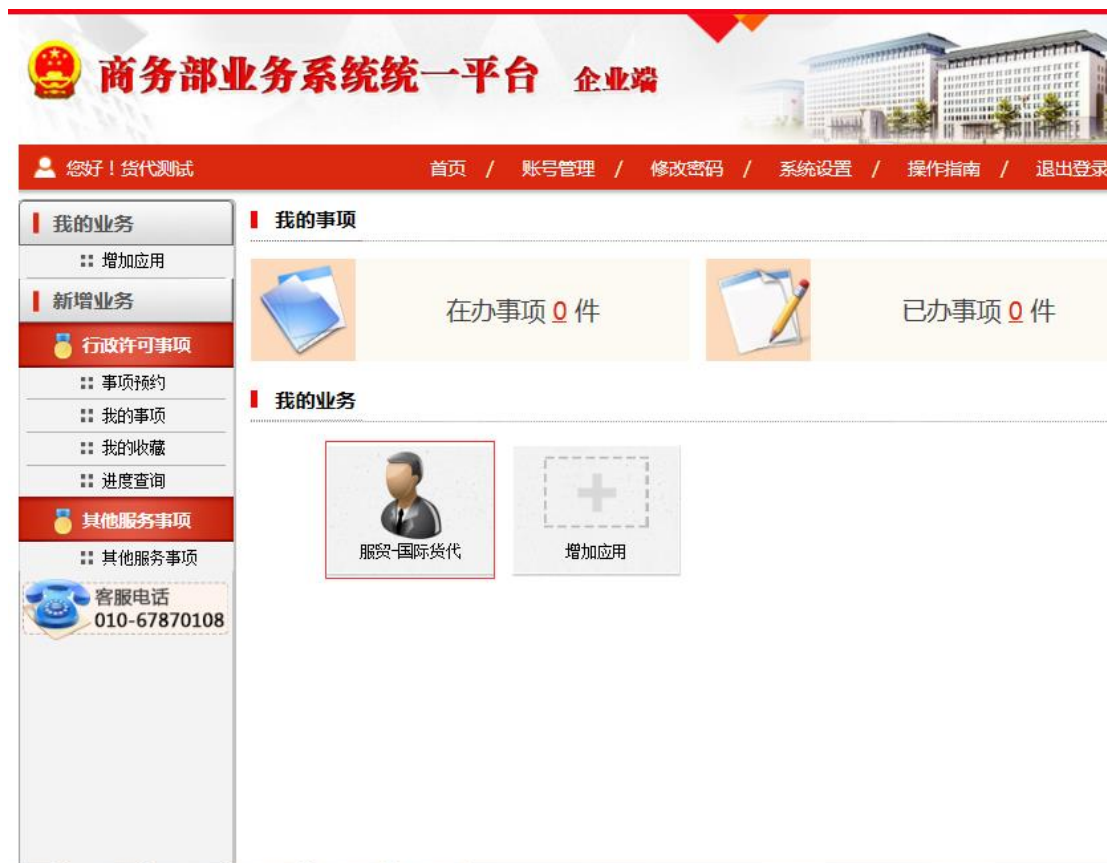
图 2-1-8 商务部统一平台业务大厅

修改完成后，需要继续等待地方商务主管机关审核，审核通过后就可以进入“文化贸易信息管理”应用办理业务。点击“业务大厅”按钮，进入商务部统一平台业务大厅，如下图 2-1-8：