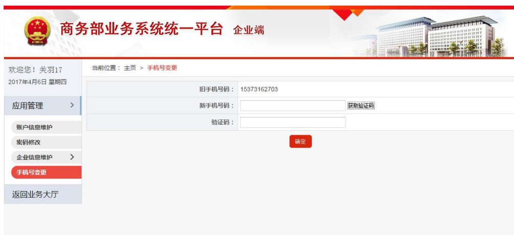
图 5-1-3 手机号变更

为了便于企业维护自己的手机号码信息，应用提供了手机号变更功能，点击菜单“应用设置”—》账号管理—》手机号变更，进入商务部统一平台手机号变更功能。