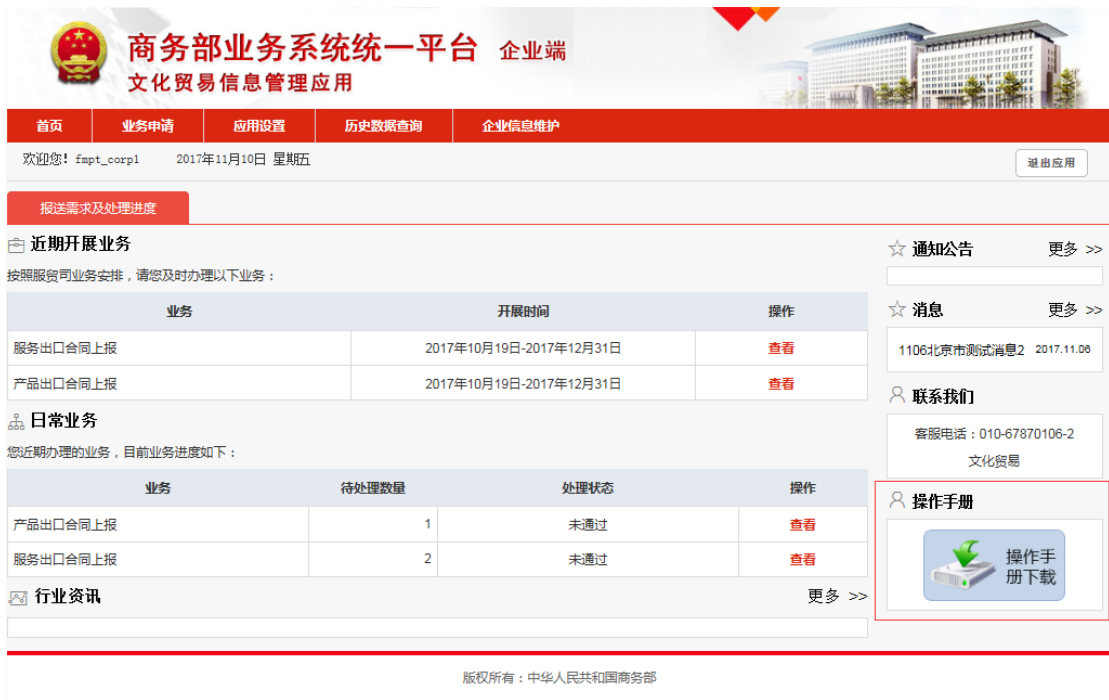
图 3-7-1 操作手册