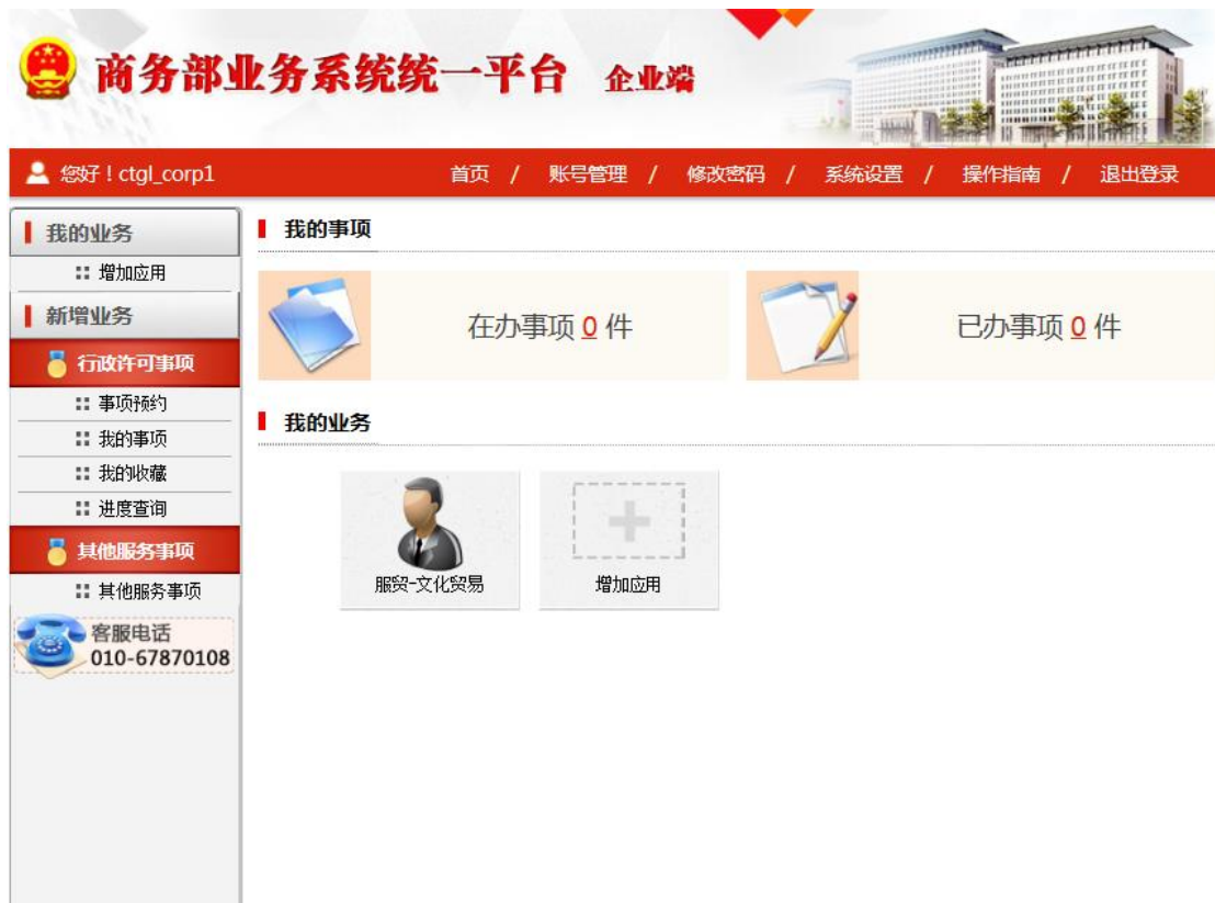
图 2-2-2 商务部统一平台业务大厅 点击该图标即可进入文化贸易信息管理应用，如图 2-2-3