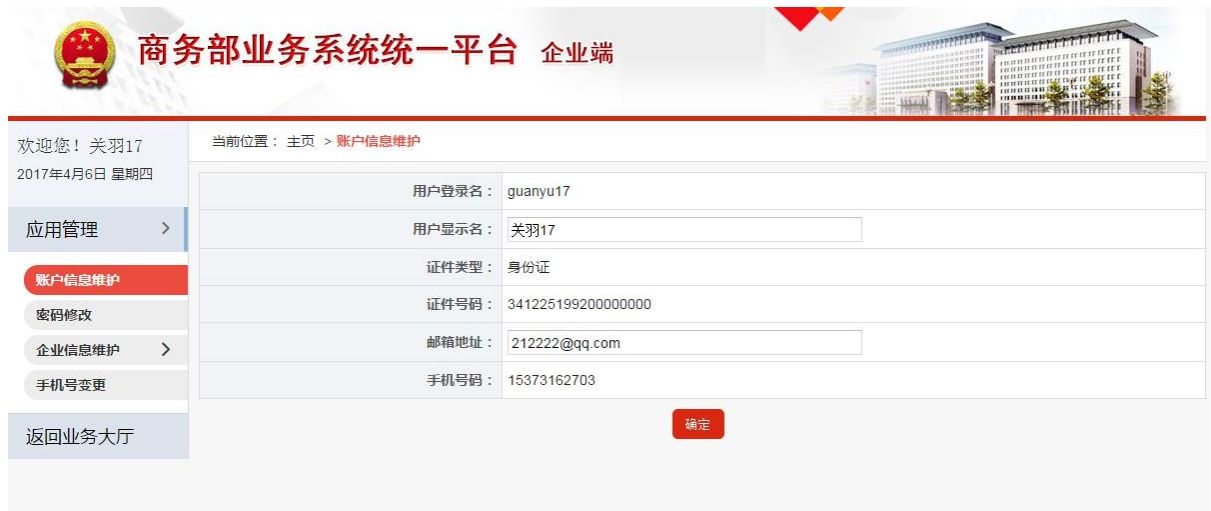
图 5-1-1 账户信息维护

为了便于企业维护自己的账户信息，应用提供了账户信息维护功能，点击菜单“应用设置”-》账户管理，进入商务部统一平台账户管理功能。