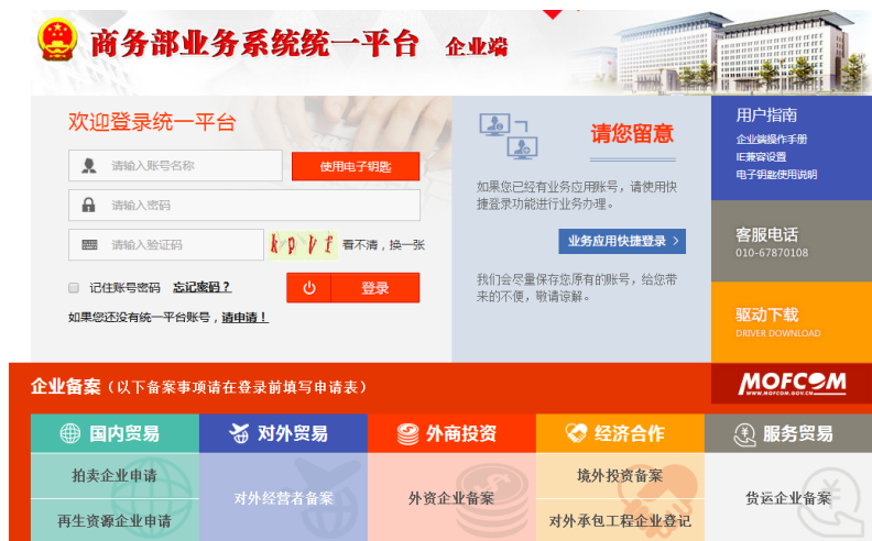
图 2-2-1 商务部统一平台登录

已有统一平台账号的用户访问商务部统一平台企业端登录地址,输入账号、密码、验证码后,进行登录操作,如图下图 2-2-1: