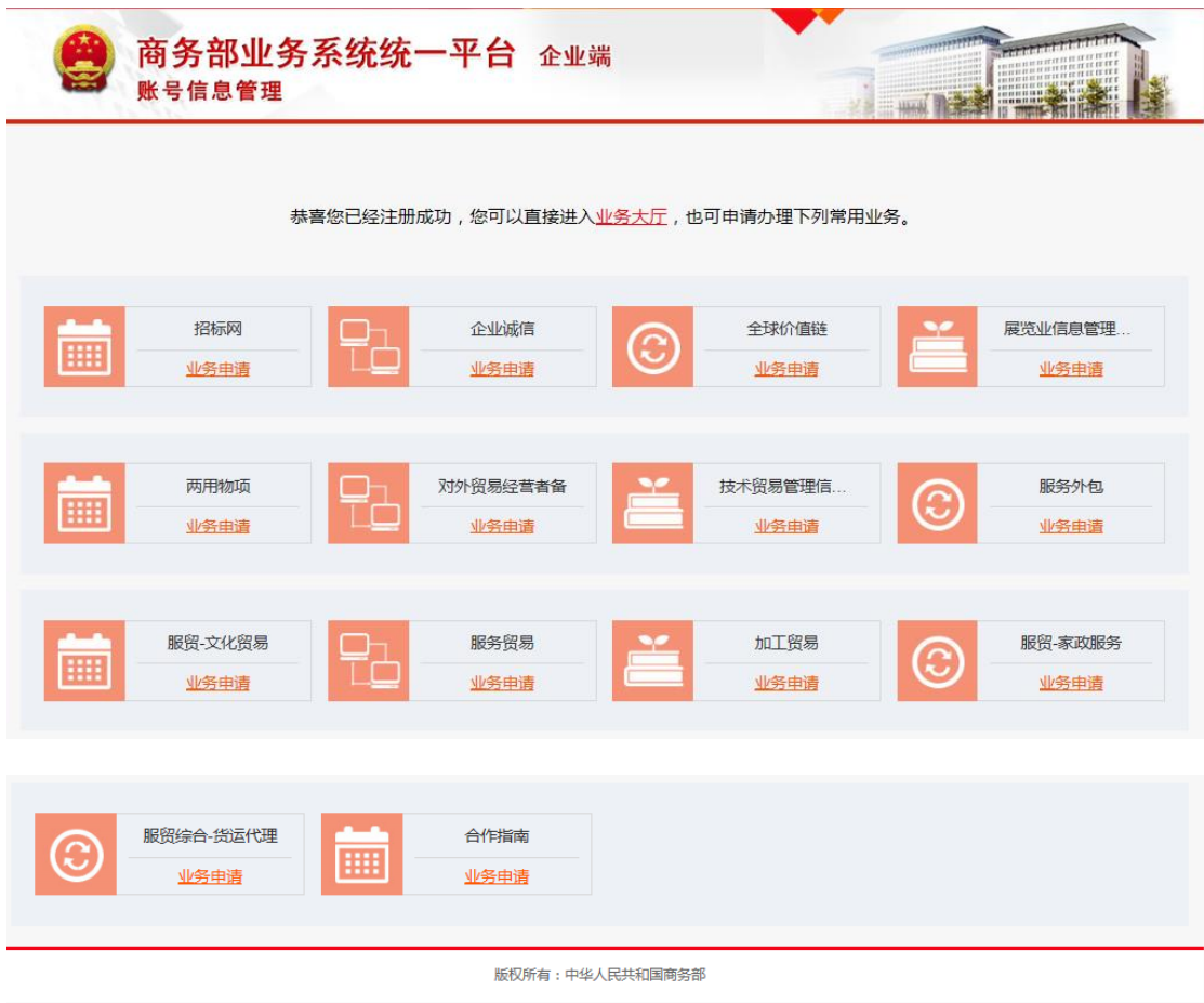
图 2-1-3 商务部统一平台账号注册