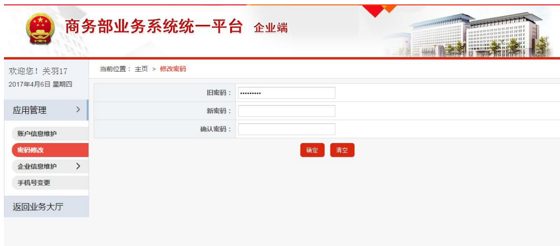
图 5-1-2 密码修改