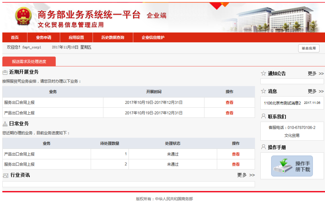
图 2-2-3 文化贸易信息管理首页